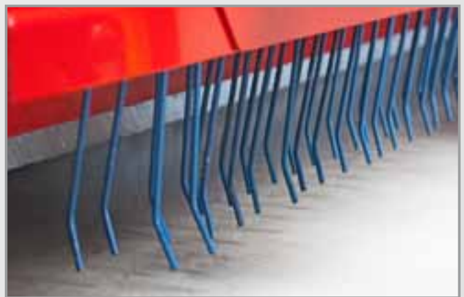
Grabki do spulchniania zbitego materiału wypełnienia