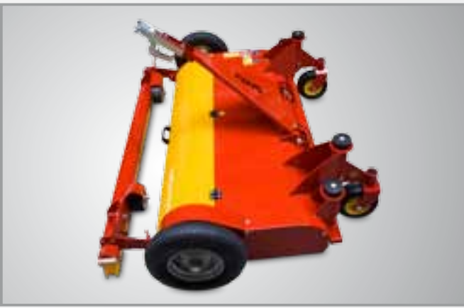
Zespół szczotki stałej i ustawny dyszel prowadzący