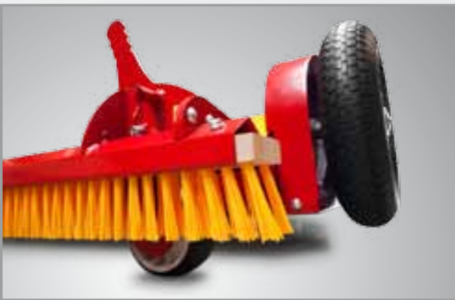
Wysuwane rolki transportowe do łatwego przejazdu w miejscach ciasnych