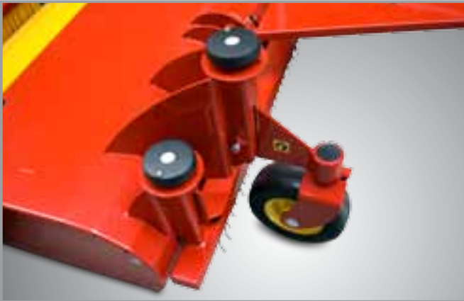
Wrzeciona regulujące ustawienie szczotek i dyszel prowadzący