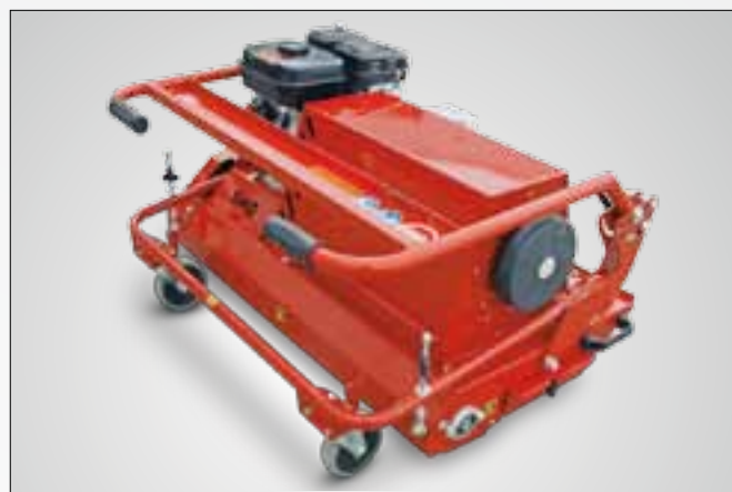
Składane ramię sterownicze zapewniające łatwy transport i oszczędne powierzchniowo przechowywanie