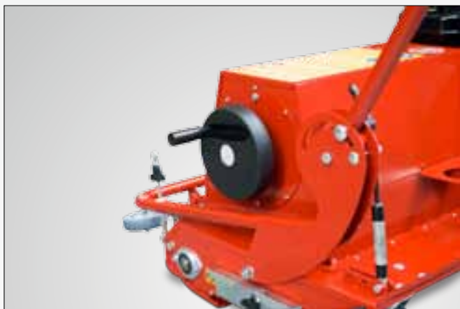
Pokrętko do czyszczenia filtra stałego