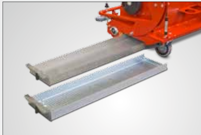
Wymienna szuflada z sitami możliwość użycia różnych perforacji sitowych