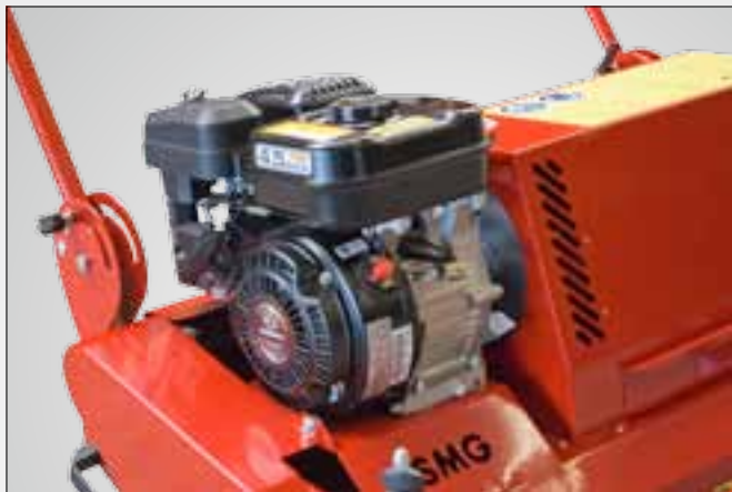
1 cylindrowy silnik benzynowy do zestawu szczotek i turbiny